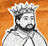
D. Afonso III